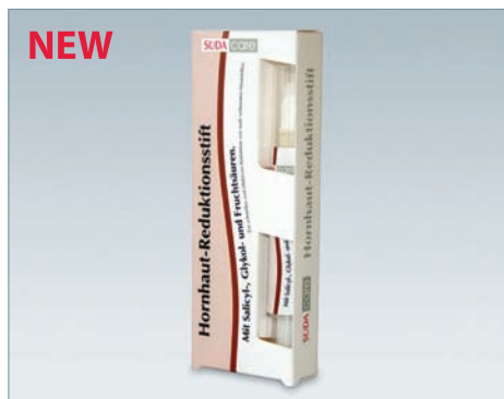
Артикул 5085 4 мл

Активные составляющие: вода, салициловая, молочная, винная, гликолевая и фруктовая кислоты, пантенол.