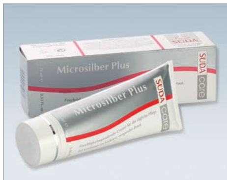
Артикул 5032 75 мл

Активные составляющие: вода, хлоргидрид алюминия, экстракт ромашки лечебной, мочевины, микросеребро.