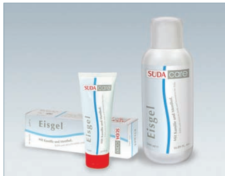
Артикул 5043 75 мл Артикул 5043.3 500 мл

Активные составляющие: вода, изопропиловый спирт, касторовое масло, ментол, экстракт ромашки лекарственной, токоферол (витамин E), азулен, бисабол.