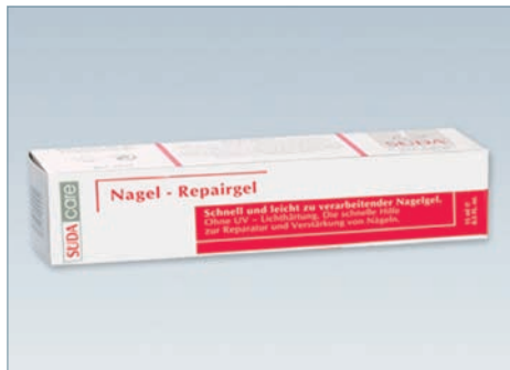
Артикул 5080 15 мл

Активные составляющие: клотримазол, вода, токоферол.