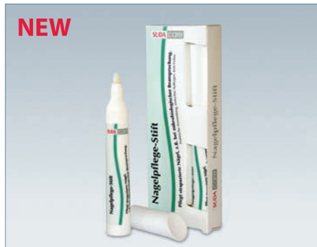
Артикул 5084 5 мл

Активные составляющие: пантенол, кератин, масло жожоба, масло плодов оливы, масло листьев чайного дерева, масло ягод можжевельника обыкновенного, масло лимонника эвкалиптового, масло семян клещевины обыкновенной.