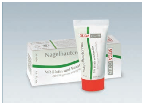
Артикул 5051.7 30 мл

Активные составляющие: вода, глицерин, экстракт календулы, экстракт ромашки лекарственной, глицерин, мочевины, соевое масло, алантоин, лецитин, токоферол.