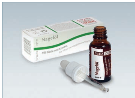
Артикул 5051.8 20 мл

Активные составляющие: вода, касторовое масло, пантенол, экстракт ромашки лекарственной, биотин, кератин, бисаболол, экстракт лишайника.