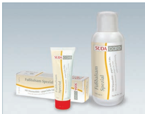
Артикул 5042 75 мл Артикул 5042.3 500 мл

Активные составляющие: вода, минеральное масло, ромашки лекарственной, экстракт корня имбиря, токоферол (витамин E), камфара, аллантоин, лецитин, бисабол.