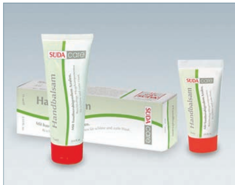
Артикул 5049 75 мл Артикул 5049.7 30 мл

Активные составляющие: вода, вазелин, глицерин, экстракт ромашки лекарственной, токоферил, аллантоин, лецитин, молочная кислота.