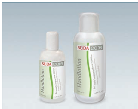
Артикул 5049.2 200 мл Артикул 5049.3 300 мл

Активные составляющие: вода, глицерин, экстракт ромашки лекарственной, токоферол (витамин Е), аллантоин, лецитин, молочная кислота.