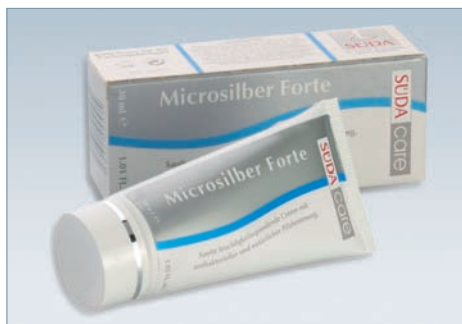
Артикул 5031 30 мл

Активные составляющие: вода, хлоргидрид алюминия, экстракт ромашки лечебной, микросеребро.